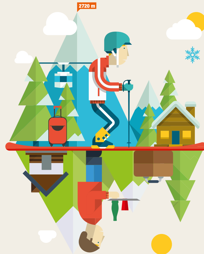
CRÉATION : ATELIER-CONTUREMAISON.COM